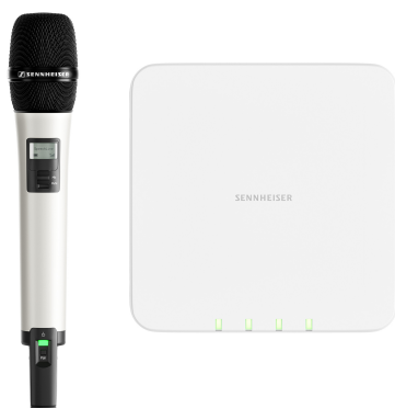
Wielokanałowy odbiornik z serii Sennheiser SpeechLine Digital Wireless idealnie pasuje do nowoczesnej infrastruktury IT

Warszawa, 11 lutego 2020 r. — Niezawodne rozwiązania audio dla całego kampusu uniwersyteckiego lub firmy: na ISE 2020 Sennheiser pokaże, jak łatwo można wdrożyć i zintegrować systemy audio, a także zarządzać i konserwować rozbudowane instalacje. Podczas największych na świecie targów AV, niemiecki producent zaprezentuje najnowszą generację systemu wspomagania słyszenia MobileConnect opartego o streaming treści audio, który umożliwi studentom indywidualne dostosowywanie odbieranego dźwięku. Kolejną nowością jest rozbudowa bezprzewodowego systemu mikrofonowego SpeechLine Digital Wireless o nowy wielokanałowy odbiornik, którego formę i funkcjonowanie zaprojektowano z myślą o nowoczesnych infrastrukturach IT.