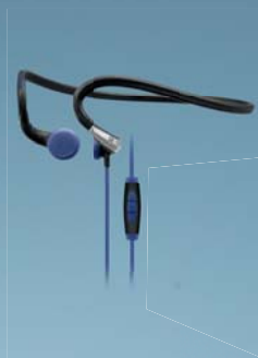
PRZENOŚNA ROZRYWKĄ. SENNHEISER/ADIDAS SPORTS.

PX 685i Trenuj i biegaj, czując się w pełni komfortowo ze słuchawkami sportowymi Sennheiser/adidas PX 685i. Pałąk układa się do kształtu głowy, zapewniając bezpieczne i indywidualne dopasowanie, a przetworniki o wysokiej skuteczności pozwalają uzyskać energetyzujący dźwięk stereo, motywujący Cię podczas biegu lub treningu. Inteligentny pilot zdalnego sterowania i mikrofon wbudowany w kabel umożliwia pełną kontrolę nad utworami i połączeniami, pozwalając skupić się na treningu.