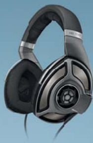
AUDIOFILSKI DŹWIĘK. KOMPONENTY HIGH-END.

HD 650 Dzięki ręcznie dobieranym i wysoce zoptymalizowanym systemom magnesów dla każdej pary, te otwarte, dynamiczne słuchawki hi-fi są produktami najwyższej klasy.