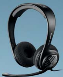
GAMING. ZESTAWY PC I DO KONSOL.

PC 300 G4ME Doskonały wybór dla graczy, którzy lubią podróżować. Model PC 300 G4ME to lekki, douszny zestaw słuchawkowy. Dzięki trzem różnym rozmiarom końcówki dousznej model PC 300 jest wygodny w użytkowaniu i zapewnia pełne doznania dźwięku doskonałej jakości, bez rozpraszających dźwięków tła.