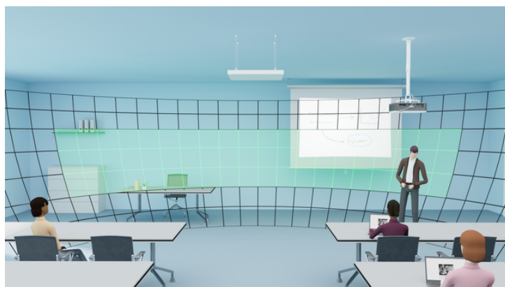
TCC 2 umożliwia określenie stref priorytetowych (zielony kolor na grafice) w celu niezakłóconego odbioru mowy

Za pomocą aplikacji Sennheiser Control Cockpit można tworzyć strefy priorytetowe i zaawansowane strefy wykluczenia, aby wyznaczyć miejsca, w których dźwięk jest głównie odbierany oraz w celu wyeliminowania źródeł hałasu.